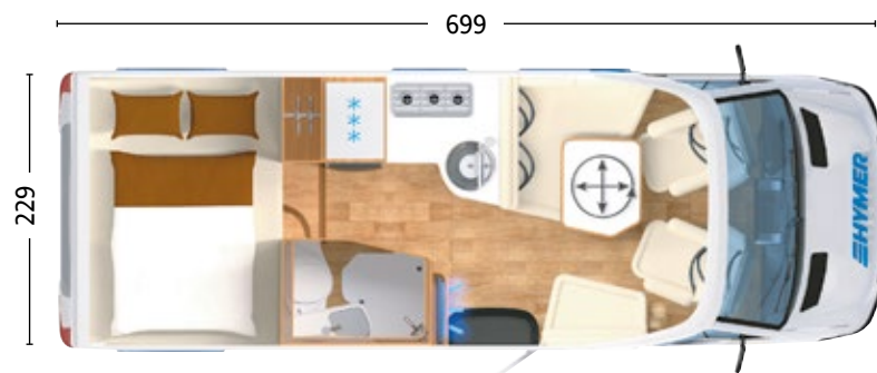
HYMER B-KLASSE MODERNCOMFORT T 550

Gesamtlänge ca. 699 cm Gesamtbreite ca. 229 cm Gesamthöhe ca. 296 cm Einzelbetten-Größe 205 x 142 cm Sitzplätze 4 Schlafplätze 4