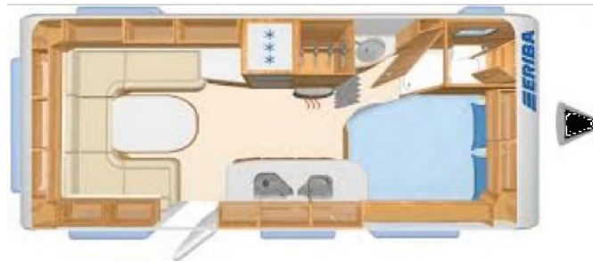
Hymer Eriba Living 425